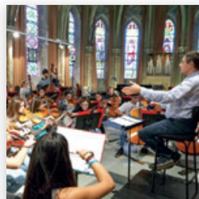
Culture et Animations