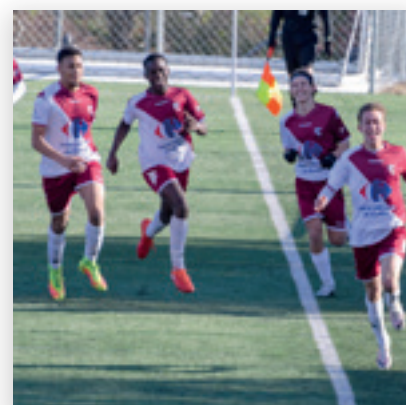
Football Entente St Cément/Montferrier