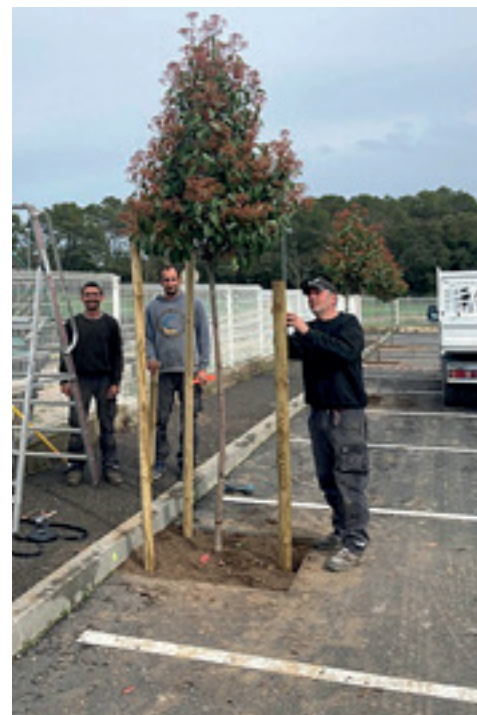
Plantations d'arbres devant le Devézou