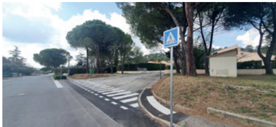
Lotissement Val de Montferrier - Chemin de la Qualité

Les murs extérieurs de la cantine vont être crépis pendant les vacances de Pâques et elle va enfin retrouver son allure d'antan !