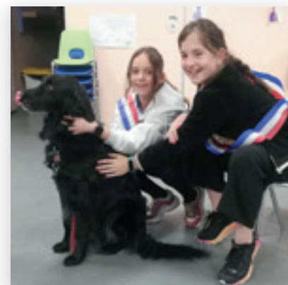
Conseil municipal des enfants

Association Culture et Loisirs En Bonne Compagnie Association Aqueduc Les Amis de la Chapelle de Baillarguet Taekwondo ESCM Tennis club de Montferrier-sur-Lez Société de chasse Lez'Arts du Sud