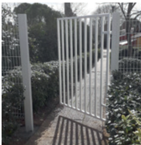
Sécurisation des écoles avec mise en place d'un portail et d'un portillon