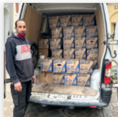
Montferrier-sur-Lez solidaire avec l'Ukraine