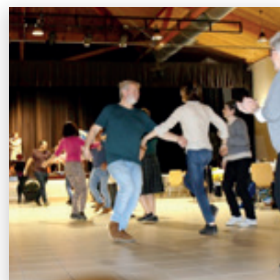
Aqueduc Ceilidh Club