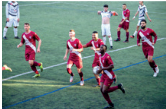
Les Seniors 1 face à Lunel Gc

En ce début du mois d'Avril, nous entrons dans la fin de saison, communément appelée Money time.